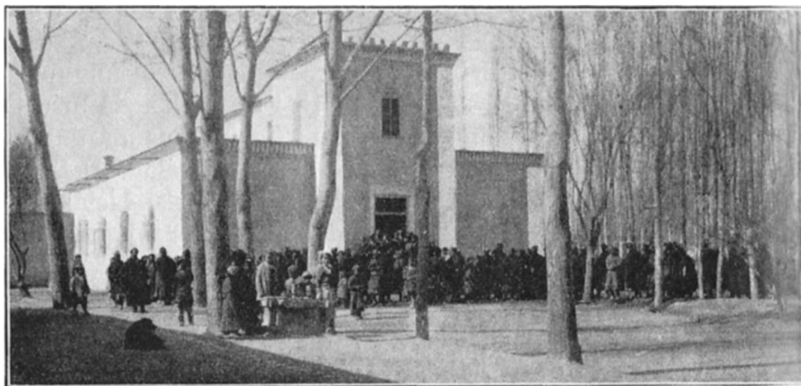
KYRKAN I JARKEND.

Men tomten var liten och utvecklingsmöjligheterna minimala. Detta gjorde sig mer och mer kännbart, i synnerhet då med tiden nya missionärer ankommo och flera boningshus måste uppföras. Även en predikolokal blev av behovet påkallad. Det blev ett skarvande och lappande, så att det hela till sist blev något underbart. Husen trängdes med varandra och bokstavligen hängde på varandra. I tolv år måste denna station vara utgångspunkt för den alltmera svällande verksamheten i Jarkend. Då kunde en ny tomt förvärvas på en centralt belägen, rymlig och trevlig plats. Och där uppfördes samma år Östturkestans största missionsstation.